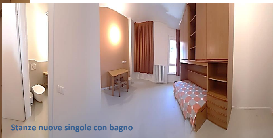
Stanze nuove singole con bagno